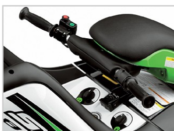
30 års stamtavla