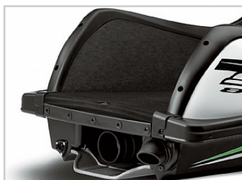
Skydd och komfort