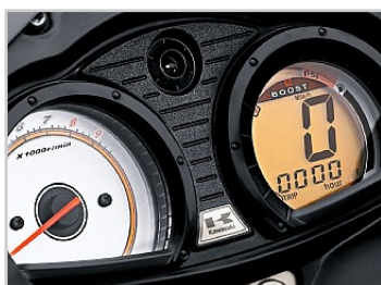
Varvräknare och LCD-display