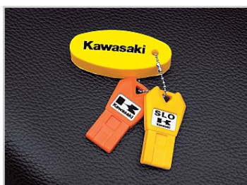
Smart Learner Operation (SLO) läge