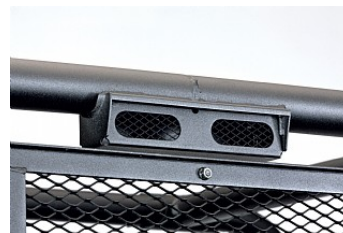
Ren, kall luft