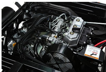
Moment och ekonomi