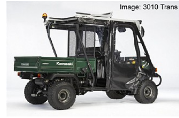
MJUK DÖRRSATS FÖR MULE4010 12 433,00 kr