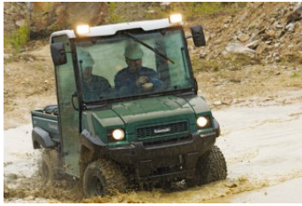
DELUXE HYTT KIT 42 162,00 kr