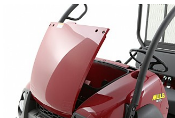
Utrymme fram och bak