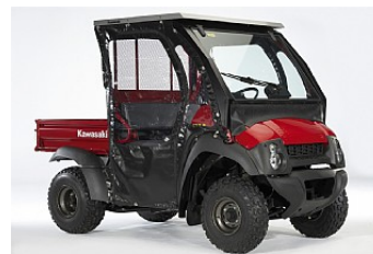
MJUKT DÖRR/BAKRUTE KIT FÖR BASIC HYTT 15 322,00 kr