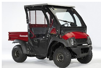
BASIC HYTT KIT (END.TAK O VINDRUTA) 11 756,00 kr