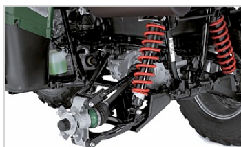
Fjädring i två steg